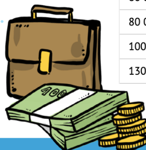
Efekt navrhovaných opatření na výpočet čisté mzdy